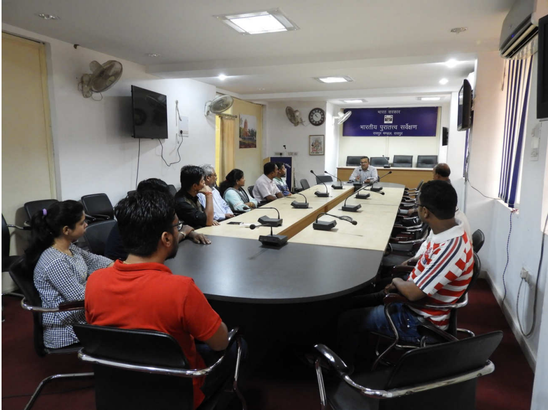
भारतीय पुरातत्त्व सर्वेक्षण, रायपुर मण्डल, रायपुर कार्यालय के सभाकक्ष में अधिकारियों/अधीनस्थ अधिकारियों की उपस्थिति/ Presence of Officers/Officials in the Conference Hall of Archaeological Survey of India, Raipur Circle, Raipur.

Archaeological Survey of India, Raipur Circle, Raipur, Chhattisgarh observed Sadbhavana Diwas on 20-08-2019 at 11:00 hrs in the Conference Hall of the office. All the Officers/officials present took Sadbhavana Pledge. Shri Uday Anand Shastry, Superintending Archaeologist (In-charge), delivered brief of objectives of observing of Sadbhavana Diwas. Some photographs on this occasion are as under:-