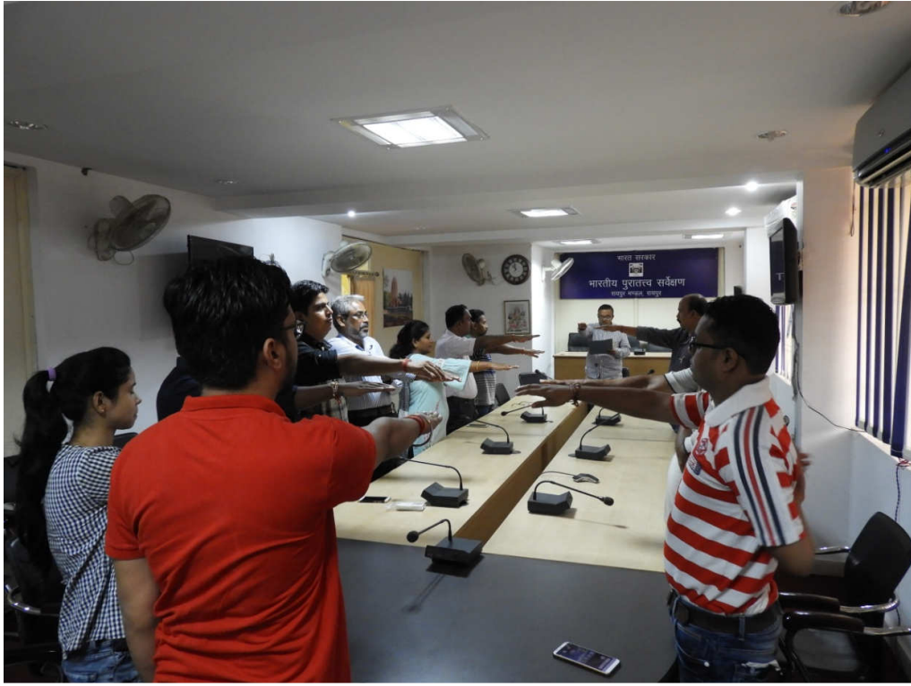
अधिकारी / अधिकारियों द्वारा सद्भावना शपथ ग्रहण Officers/officials taking Sadbhavna Pledge